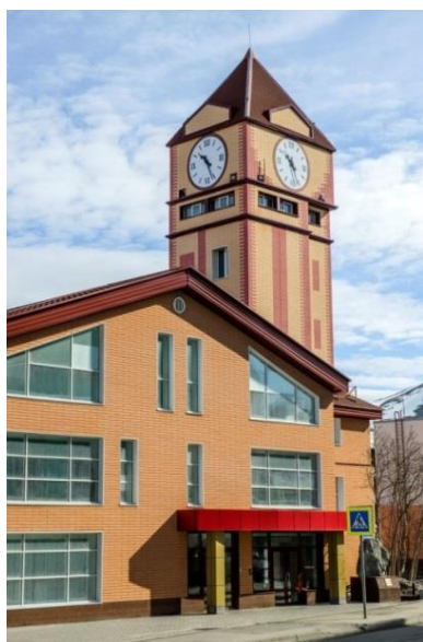
Рис. Здание МВЦ «Апатит»

Цели проекта: создание интерактивного музея, который является источником вдохновения, знания, умений и навыков, пространство которого предназначено для активной, творческой жизни здесь и сейчас. Главное предназначение музея – быть центром культуры, образования и воспитания различных возрастных категорий посетителей, в обретении ими ценностных ориентиров. Эти изменения в роли музея и повлекли за собой создание данного проекта.