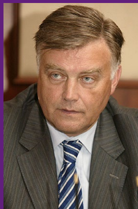
ЯКУНИН ВЛАДИМИР ИВАНОВИЧ